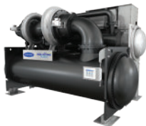
AquaEdge Wassergekühlte Flüssigkeitskühler