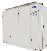
Klimageräte für Rechenzentren